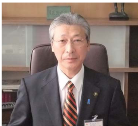
登庁第1日目（市長室にて）

んなプランがある中、それぞれの長所短所を明示して、場所がどうこうというより、その機能ですね、あるべき新発田の未来像、まちづくりという視点から、市民の皆さんのご意見を賜りたい。3月議会です。アンケート予算をお諮りし、特別債の期限である27年度には新庁舎を完成させなければなりません」