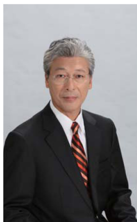
選挙ポスターの写真

「私は議長を4期やりました。しかし、それでも市長の力ははるかに大きいと肌で知りました。それは選挙で勝たせていた