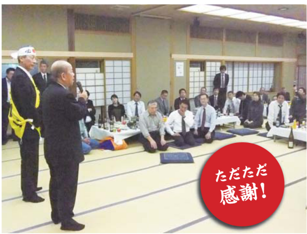
事務所スタッフの打ち上げ会